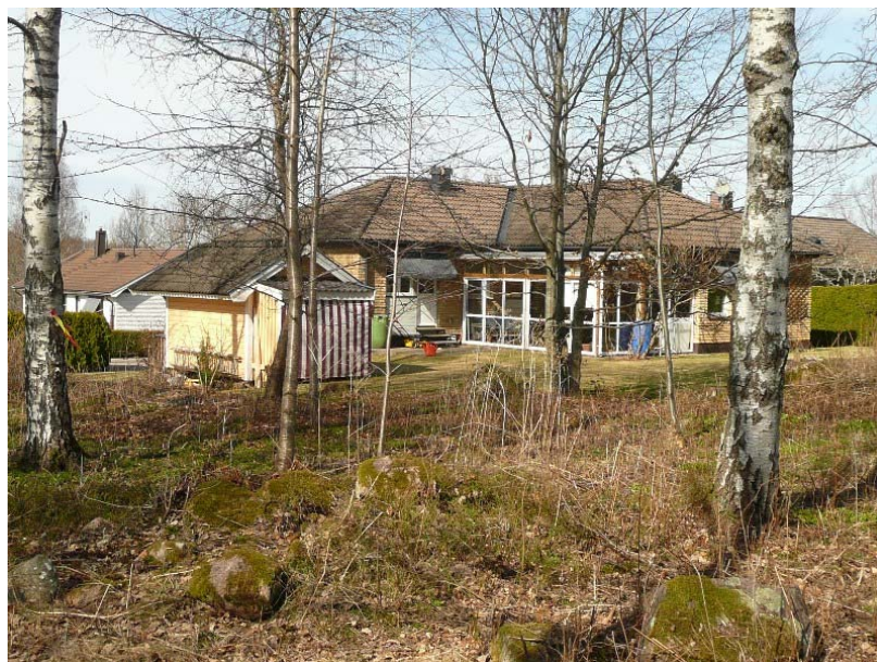
Nysörten 1, sedd från GC-vägen

Nysörten 1 ligger i småhusområdet Tostås ca 3 km söder om centrum. Planområdet innefattar bostadstomten samt kringliggande naturmark, ungefär 1,1 ha. (tomt 754 kvm + ca 420 kvm). Nysörten 1 är i privat ägo och Tostås 2:1 ägs av Tranås kommun.