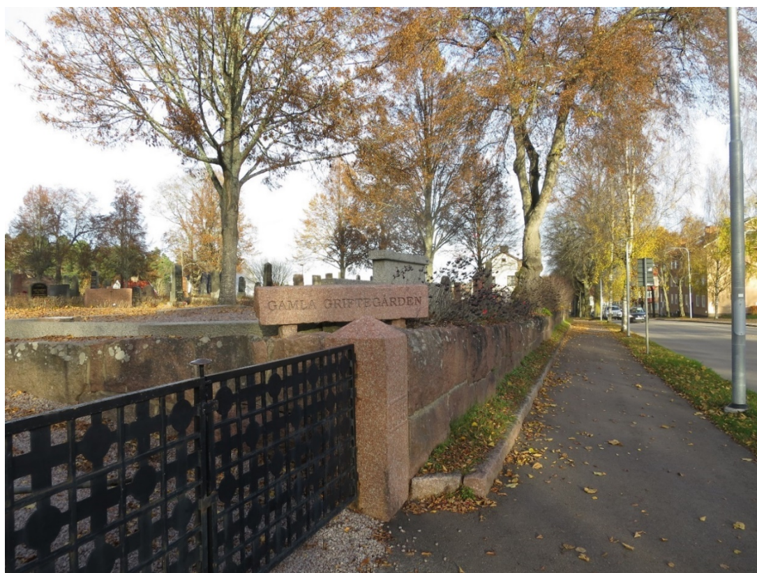
Huvudingången med breda smidesgrindar i modernistisk stil och granitstolpar som bär årtalet för anläggandet "1885". Begravningsplatsen omges av stödmurar av råkilad röd granit i kvaderhuggna block.