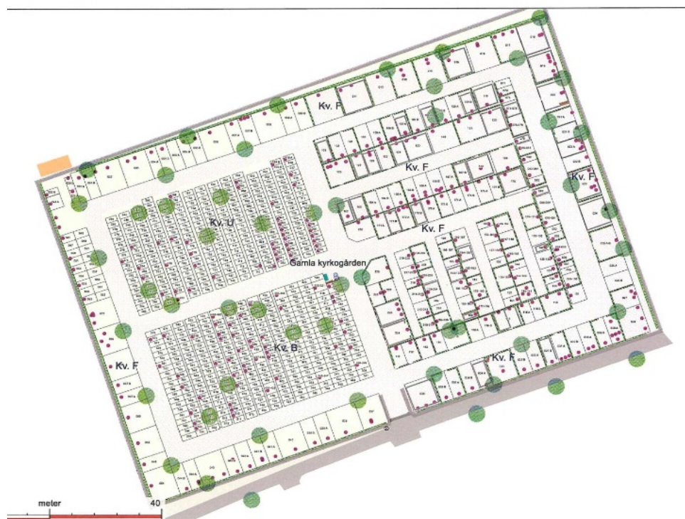
Karta över griftegården med kvartersbeteckningar.