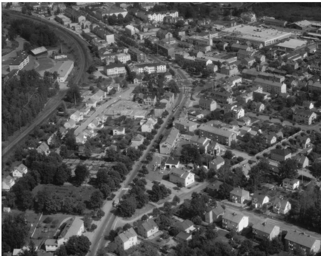
Flygfoto över Tranås södra delar 1969. Tranås gamla griftegård ligger utmed Säbyvägens norra sida och syns här till vänster i bilden.