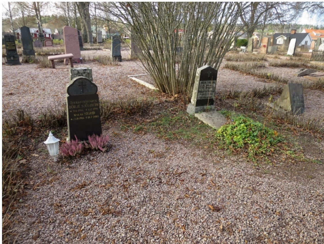
Exempel på äldre vintergrön vindelväxt vid en enskild grav (F094-095). I gravraden bakom växer en äldre buske som hör till gravens prydnad (F134).

Många växter inom gravrätten har dock försvunnit i senare tid.