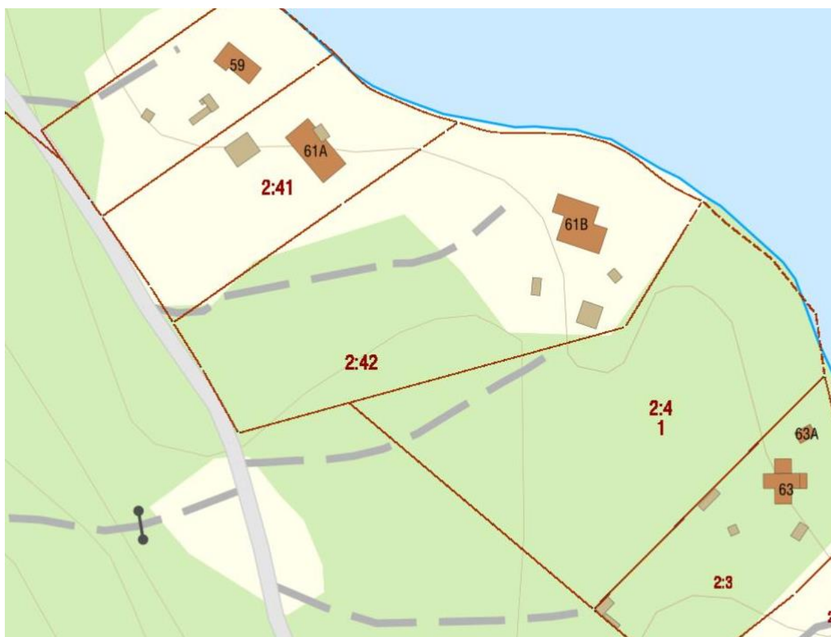
Bilden visar fastigheten Smörstorp 2:42

Ändring av detaljplanen innebär att aktuell detaljplan fortsätter att gälla men ändring görs för Smörstorp 2:42 i planens bestämmelser.