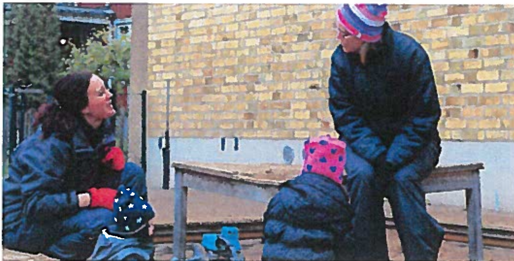
Under nästa år får pedagogerna på de kommunala förskolorna i Motala fria arbetskläder.