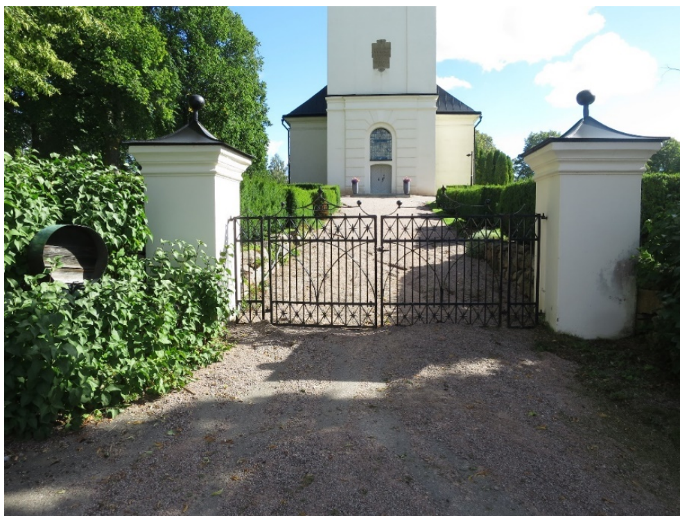
Huvudentrés grindar från 1869. Dessa har sekundärt breddats och då försetts med sidogaller. Utanför står den ålderdomliga fattigbössan.

Vid lagningar av de handsmidda kloten till samma grindar bör plåtslagare kunnig i äldre plåthantverk anlitas. Underhåll av smidesgrindarna och fattigbössan bör ske restriktivt och med traditionella metoder och material anpassade för ett långsiktigt bevarande.