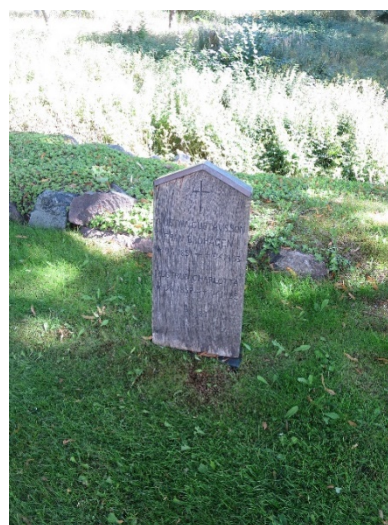
Vårdar vid museal uppställning öster om kyrkan. Den enda kvarvarande brädvården är denna "ekplanka" från 1927.

Målsättning och riktlinjer: Ibland uppstår frågan om ansvar och skydd för en enskild gravvård. Så länge gravrätten inte gått ut ägs graven och dess inrättningar av gravrättsinnehavaren. När gravrätten gått ut övertas ansvaret av upplåtaren, i det aktuella fallet Griftegårdsenheten. Gravanläggningar och gravvårdar som har ett kulturhistoriskt värde skyddas generellt av kulturmiljölagen. Att ändra eller ta bort gravvårdar som har ett kulturhistoriskt värde kräver därför tillstånd från länsstyrelsen. Detta gäller även gravramar, häckar, grusning mm.