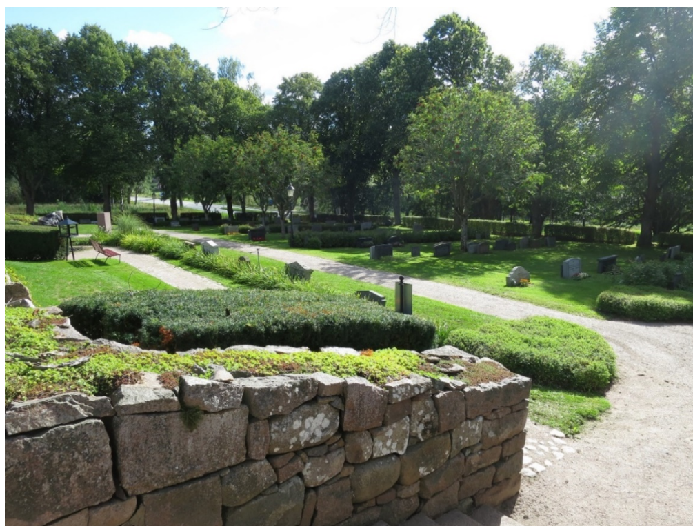
Nya kyrkogården, kvarter E, har både drag från anläggningstiden 1933 och från det sena 1900-talets modernistiska kyrkogårdsideal. Närmast syns minneslundan från 1994.

Den tidigare bergiga och outnyttjade gravytan nordost om gravkoret togs i anspråk för begravningar på 1990-talet.