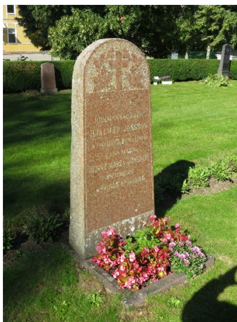
Exempel på typiska familjegravvårdar från 1920-talet inom kvarter B.