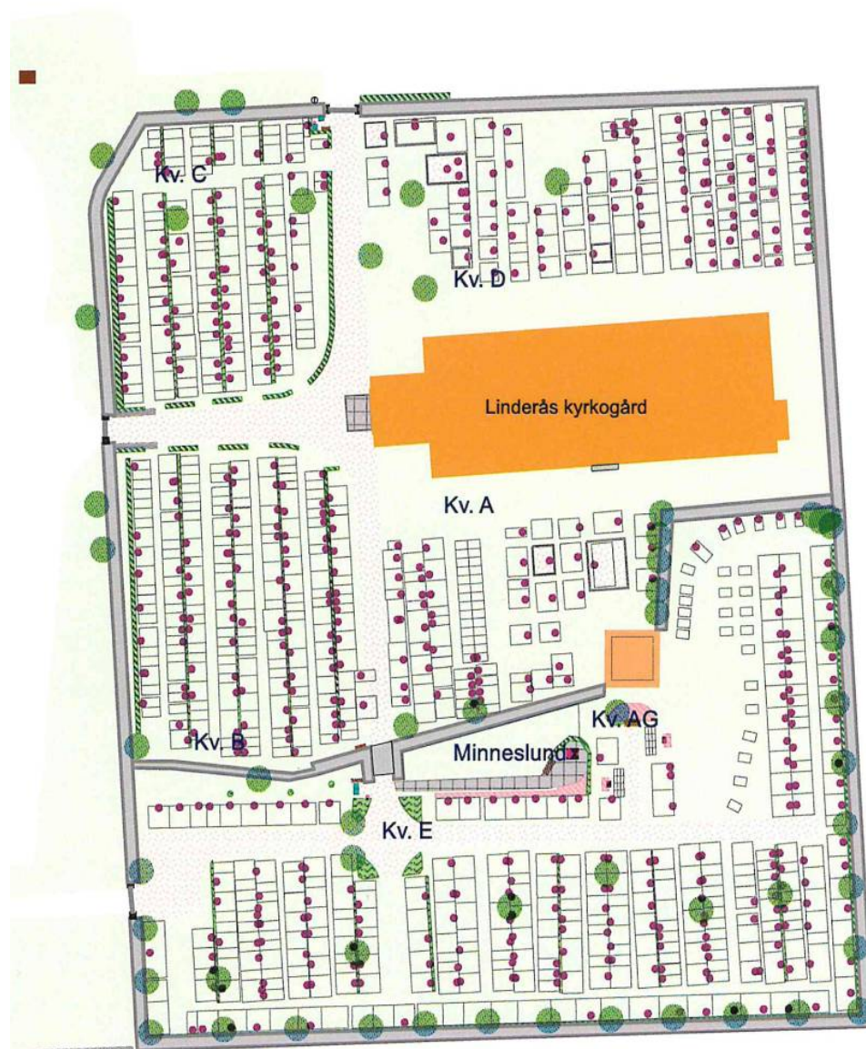
Karta över kyrkogården med kvartersbeteckningar.