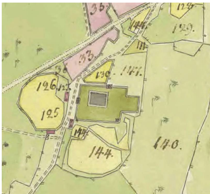
Storskifteskarta över Linderås kyrkby 1795. Läget för den gamla kyrkan finns här utmärkt. De båda ingångarna till kyrkogården var belägna mot landsvägen i norr och väster. Kyrkogården hade nyligen utvidgats åt öster för att skapa utrymme för den nya kyrkan. LMS.

Befintlig lyktbelysning utökades i antal 1999 samtidigt som nya skötselplatser anordnades. Ny askgravplats anordnades 2015 i anslutning till viloplatsen söder om gravkoret på nya kyrkogården.