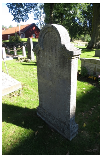
Kyrkogårdens två äldsta högtreståndsgravvårdar är från 1800-talets början och finns i kvarter D norr om kyrkan.